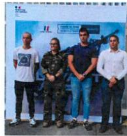
SIGNATURE DE CONTRATS DU 07/09/21