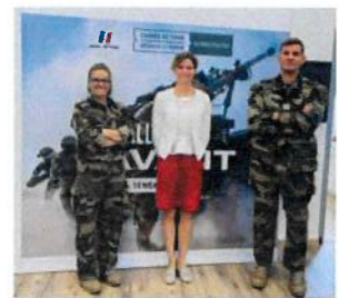
VISITE DE MME LA SOUS- PREFETE DE FIGEAC LE 01/09/21