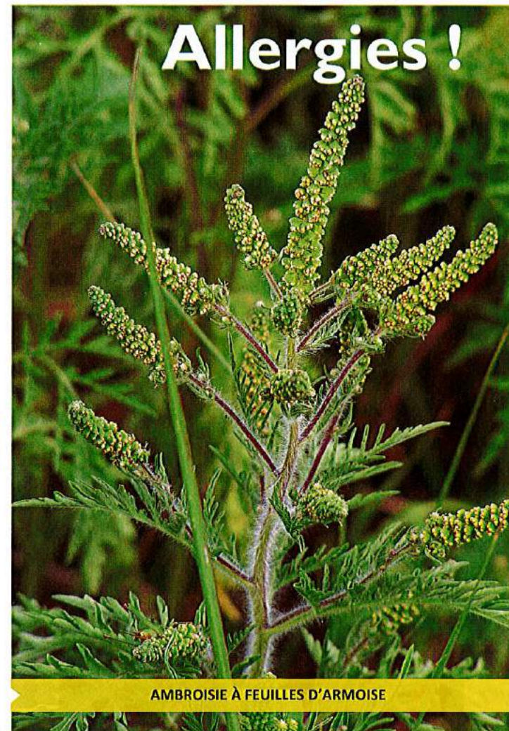
AMBROISIE À FEUILLES D'ARMOISE